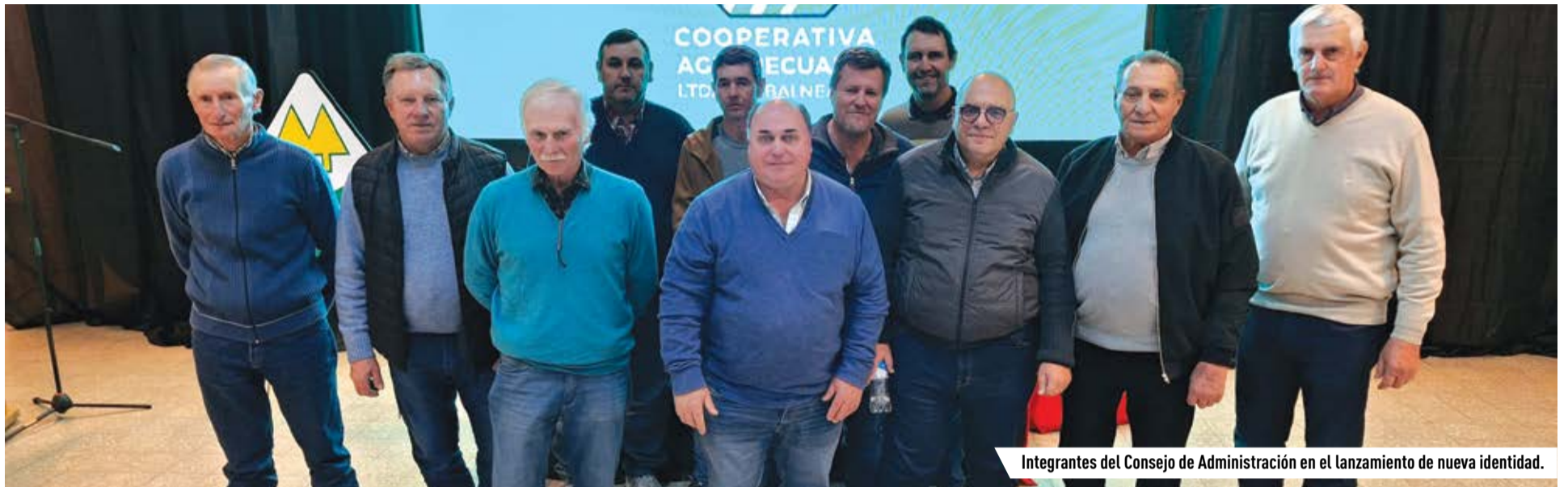
Integrantes del Consejo de Administración en el lanzamiento de nueva identidad.

» BALNEARIA – Dpto. San Justo Comprometida con el desafío de responder a las demandas actuales de los productores, la institución está avanzando en un proceso de reorganización, que incluso llevó a un cambio de denominación.