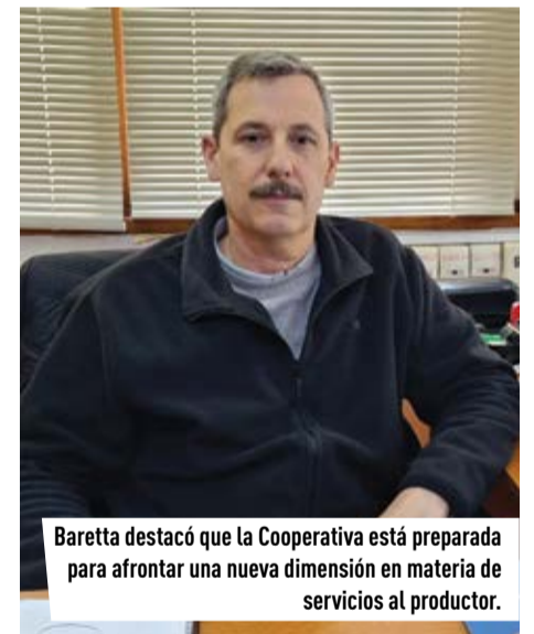
Baretta destacó que la Cooperativa está preparada para afrontar una nueva dimensión en materia de servicios al productor.

El encuentro contó con la presentación del economista rosarino Salvador Di Stefano, quien habló del contexto actual de la economía con una mirada productivista. También se presentó el nuevo isologotipo de la entidad, culminando con una cena de agasajo para los asistentes. ■