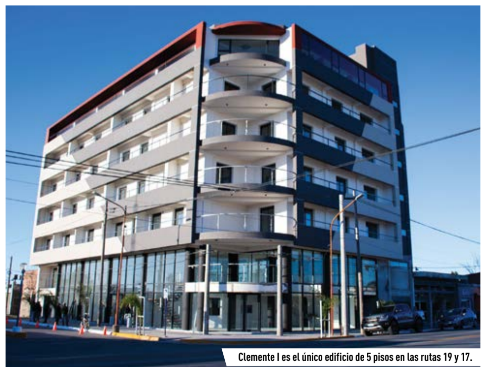
Clemente I es el único edificio de 5 pisos en las rutas 19 y 17.