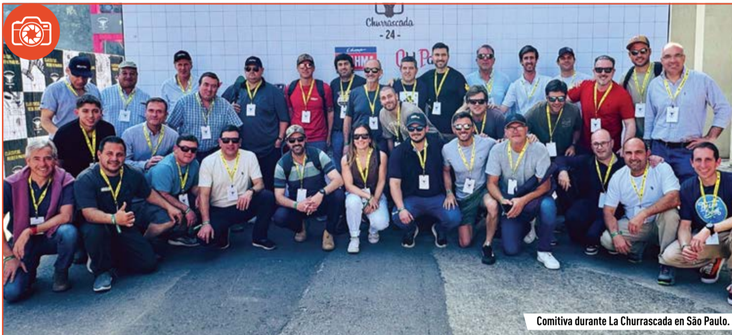
Comitiva durante La Churrascada en São Paulo.

Con más de 250 asistentes, el evento organizado en la sucursal de Pilar (Rio 2do) marcó nuevamente su impronta de la mano de las últimas novedades en conectividad, servicios y maquinaria para el agro. Como concesionario oficial John Deere y PLA, Conci es sinónimo de atención, calidad y servicio, desarrollando sus tareas de la mano de un staff compuesto por más de 230 colaboradores. Con una trayectoria de más de 40 años en el sector, suma 5 puntos de venta en toda la provincia y 9 unidades de negocio que brindan soluciones con tecnología de punta y asistencia al productor. En el marco del encuentro también se presentaron varias novedades, como el flamante tractor 7M, la conectividad y las funcionalidades del Centro de Soluciones de Conci y otras distintas unidades de John Deere y PLA. Cabe mencionar que durante el mes de septiembre se mantendrán las promociones y descuentos en maquinaria agrícola, tecnología y servicios.