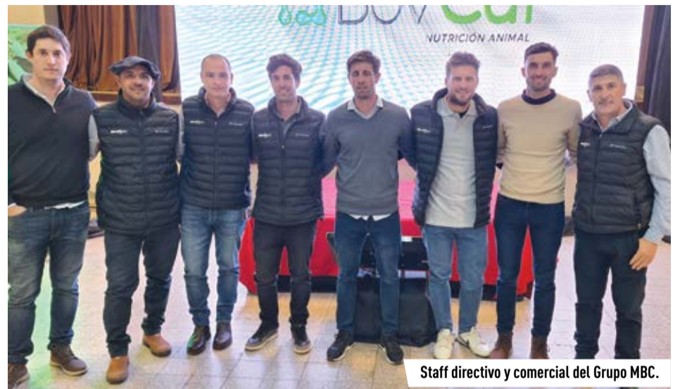
Staff directivo y comercial del Grupo MBC.

"El proyecto de la fábrica nueva viene ya desde hace más de dos años y diferentes contextos lo fueron demorando. Este año comenzó a dar formalmente sus primeros pasos, y es un proyecto a tres años que demuestra nuestra decisión de apostar a la zona y seguir