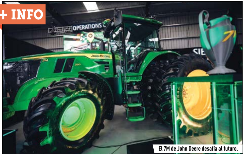
El 7M de John Deere desafía al futuro.